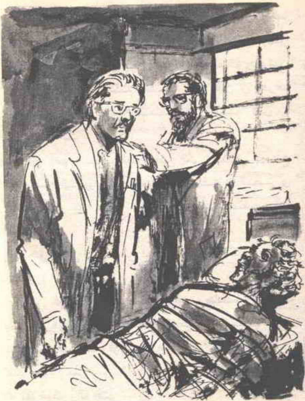
كان ( هانس ) متصلبًا يرمق الرجل الممدد وقد بدا عليه الذهول حتى إنني اضطررت لمناداته مرتين ..

- « العلاج العرضي .. أمنع الألم والهيّاج والصداع وأمنعه من الإصابة بالتهاب رئوي .. » - « تمامًا .. يمكنك أن تأتي لتراه غدًا لو كان حيًا .. »