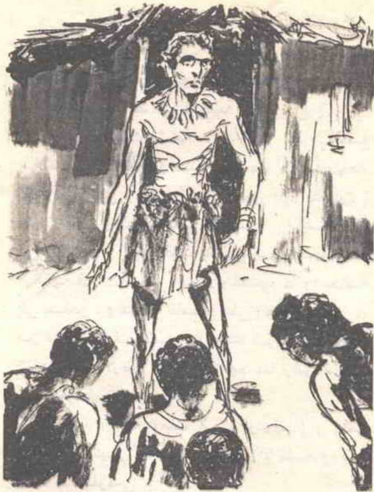
مشهد غريب .. بل ومضحك لو فكرنا في وقار ( جيديون ) وكبريائه الدائنين من درجة السماحة ..

- « لقد كانت القلادة تحوى خنفسة هائلة الحجم .. لكنها عادية جدًا .. ما هو تفسير ذلك ؟ » قال الزعيم وهو يرمق الكوخ في توجس : - « يقولون إن ( مولوك ) يتخفى في شكل ( جنذب ) .. وخنفسة النمر تفتك بالجنادب .. ويقولون إن روح الخير تتخفى في شكل تلك الخنفسة .. لهذا يهابها ( مولوك ) ويتحاشاها .. » تفسير شاعري لفظي أكثر من اللازم .. لكن الأمر كله يتحدى التفسير .. والحقيقة ها هنا هي أن ( مولوك ) كان يخاف القلادة ، والقلادة لم تحو سوى خنفسة .. فما معنى هذا ؟ ..