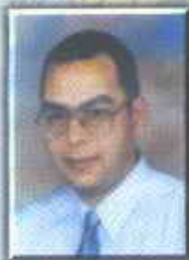
د. احمد خالد توفيق

أشياء لاتحدث إلا نهاراً ، وأشياء لاتحدث إلا ليلاً .. هذه الأخيرة تتباين دوماً .. لكنها دائماً مفرجة أو مخيفة أو بشعة أو ممنوعة .. هذا شيء طبيعي . وإلا فلماذا لاتحدث إلا ليلاً .