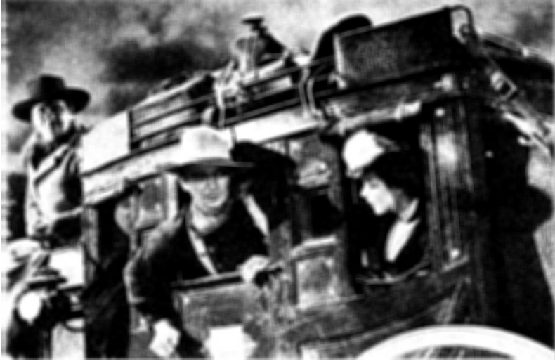
فيلم عربة السفر

و لسوء الحظ ، كثيرا ما يحدث أن يكتب الكاتبون سيناريوهات يجلس فيها أشخاص يتحدثون عن الماضي والحاضر والمستقبل . وما هو أسوأ أنهم يختارون مواضيع لا تمنح فرصة لشيء أن يحدث إلا أقل القليل . ولا تمنح فرصة للقصة لكي تتطور عن طريق أشخاص يفعلون أشياء . لقد تم عمل أفلام جيدة ، وما زال هذا ممكنا ، بأماكن قليلة جدا وحركة محدودة تماما . ولكن لهذا النوع من الأفلام مشاكله الخاصة ، فتأكد أولا من أنك مستعد لمواجهة هذه المشاكل قبل أن تلقى بنفسك في مياه يحيط بها الضباب من كل جانب .