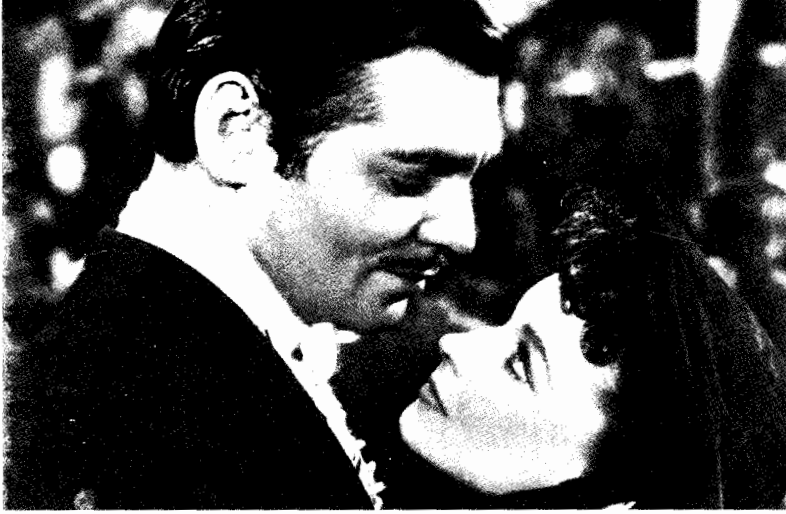
فيلم ذهب مع الريح

تتنفس ، بشرط أن يتم تبسيطها إلى حد أن تصبح مفهومة . ويمكننا أن نقول ، دون أن نخشى أى تضارب ، أن شخصيات سينمائية كثيرة قد فشلت لكونها معقدة جدا أكثر من تلك التي فشلت لكونها بسيطة جدا .