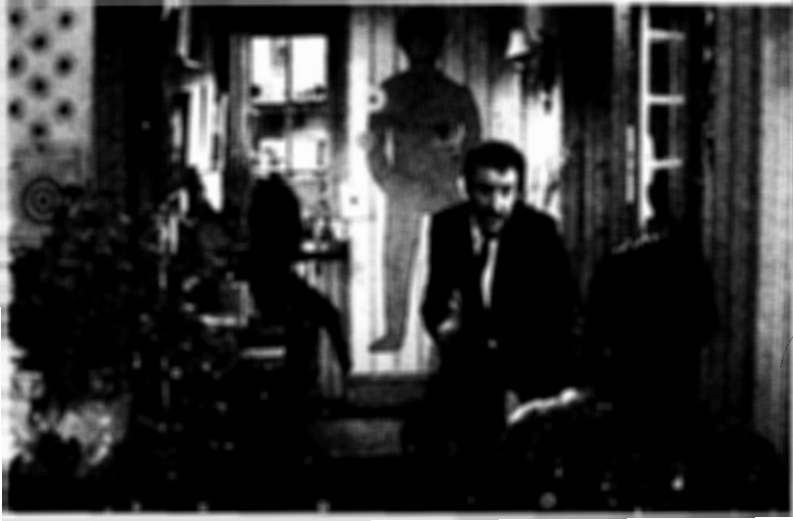
فيلم عودة الفهد الوردي

ويحضرني هنا مثال جيد لهذه النقطة بالذات ، عن قصة رجل تم اغتيال أخيه . ولقد حاول كاتب السيناريو بأقصى طاقته دون أن يصل إلى حل يقدم به الشخصيات الرئيسية - بما فيها المرأة التي قامت بمهمة القتل - مبكرا بقدر كاف .