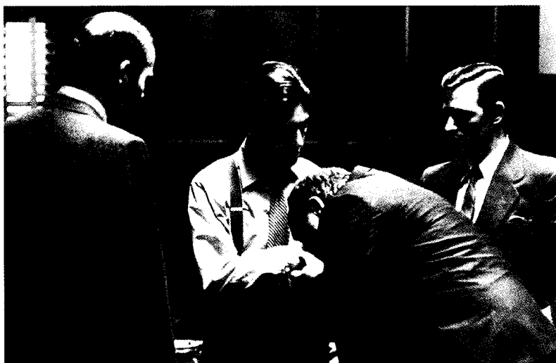
مشهد من فيلم الأب الروحي

أن تختار له أهدافاً فريدة في نوعها، وخلفية ومواقف ومظهراً وسلوكيات وطريقة كلام وكل ما يخطر على بالك . أنظر إلى ما فعله تيرى سودرن مع شخصية «كاندى» بأن عكس كل ردود أفعال الشخصية الأصلية «البراءة الحلوة» عما نتوقه عادة . أو إعادة تكوين شخصية «الرجل الحديدى» بجعله رجلاً في مرحلة النفاضة يجلس على مقعد متحرك . . . وتصوير بوزو للمافيا على أنها جمعية خيرية في فيلم «الأب الروحي» وفيلم «الراكب السهل» وما يضمه من متعاطى المخدرات السعداء وهم يركبون موتوسيكلاتهم عبر البلاد إلى مصيرهم المحتوم . هل يبدو أحد مشاهد الحوار مملاً وكئيبيًا؟ فكر في جمل حوار أخرى . . عشرات منها! دع السيدة العجوز تحمل موس حلقة (من النوع القديم الذى يشبه السكين المطوى) فى حقيبة يدها الصغيرة . دع زوجة الواعظ تغط فى نومها وهى تستمع لزوجها فى الكنيسة . وما رأيك فى الوحش الأدمى الذى يغمى عليه عندما يرى دما؟ السابحة الفاتنة التى تخشى الماء؟ الطاغية الذى لا يمكنه أن يقرأ؟ (لا تؤأخذنى، فمن الأفضل أن تنسى هذه الأخيرة: لأن سمرست موم بنى إحدى قصصه القصيرة النموذجية حول هذه الفكرة).