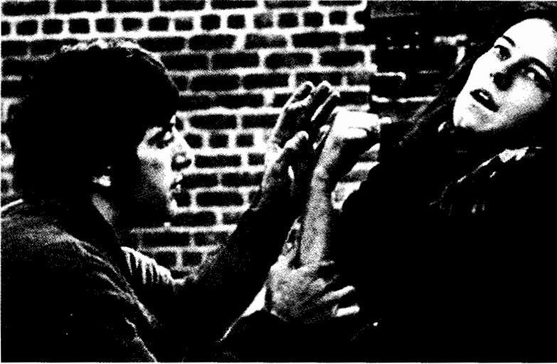
فيلم ذعر فى نيدل بارك

يفعل ماذا، ولماذا لا يقدر؟". أي الملخص الذي يعتمد على الهدف - العقبة - النتيجة . إن المهمة ليست بالغة الصعوبة، خاصة إذا كنت قد بنيت السيناريو متينا، خطوة وراء خطوة، على أساس قوي من فكرة أساسية أو توكيد للـب الموضوع . أما المهام التي لا شكل لها وغير المبنية على أساس سليم فهي المهام التي يمكنها أن تقضى عليك تماماً .