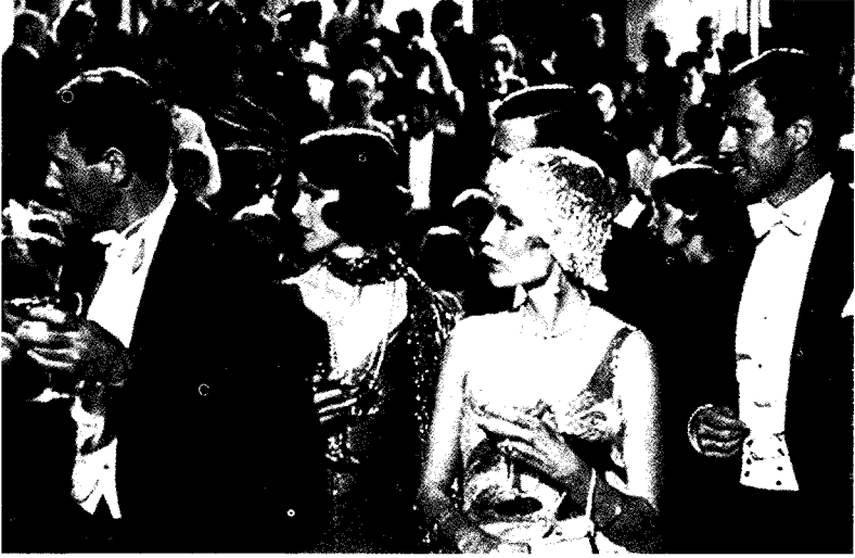
فيلم جاتسبي العظيم

و لتتفيذ هذا، فإنك تربط بين سلسلة من المواجهات التي تتبادل مع سلسلة من الإنتقالات حتى يصل الوقت إلى نهايته، لتحصل على ٩٠ دقيقة من زمن العرض السينمائي . و هناك حقيقة عدة أسئلة يمكنك أن توجهها إلى نفسك قبل أن تبدأ العمل في كتابة أى سيناريو ، وكلها أسوأ من سؤال "هل فكرتى تمنح فرصا جيدة لبناء المواجهات ؟ بمعنى أنه هل يلزم للبطل أن يناضل لكي يصل إلى ما يريد، وهل يمكننى أن أدبر أحداثا للصياغة الدرامية لهذا النضال ؟"