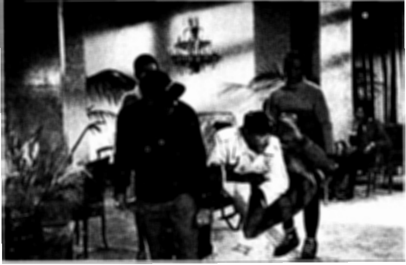
فيلم الفهد الوردي

الشاشة بقدر معقول ؟ أو بأنهم يجب أن يظهروا كثيراً من آن لآخر حتى يظل المتفرجون متيقظين لوجودهم ؟