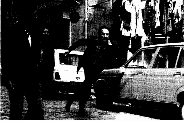
فيلم حلقة الإتصال الفرنسية

الخاليتان من أى حدقة ، والبطله والمشية الغريبة . وبيلاز لها زى الممرضة ، ولويس له شجاعته التى تصل إلى حد التهور . إنى اتفق معك على أن مثل هذه البطاقات ليست ضرورية دائماً . ولكنها فى الوقت نفسه لا تعتبر خطيئة لا تغتفر ، وخاصة عندما يكون التعرف السهل والتميز مطلوباً .