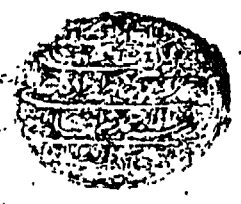
صفحة العنوان من مخطوطة الأحمديّة

يقول خليل ما أقيت من الأسي وإن لم أجد الموت بعد ما نقلت وعيني بالدين عجزود توكل في أهواله لسعيد