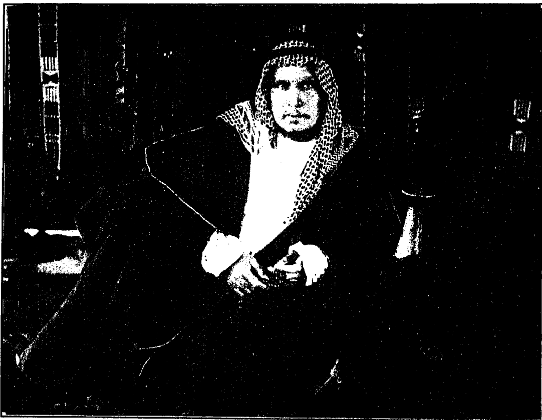
الأمير شاکر بن زيد