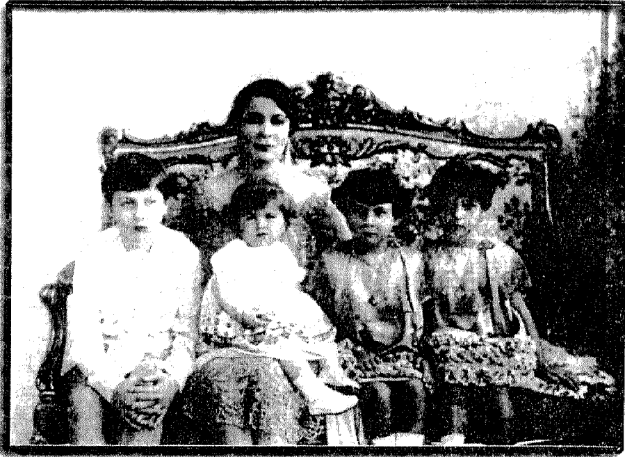
نازلي الملكة ومملكتها الصغيرة