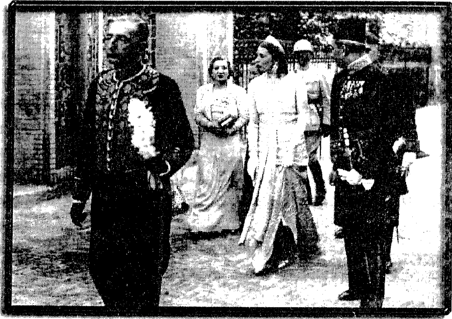
الملكة نازلي في طهران