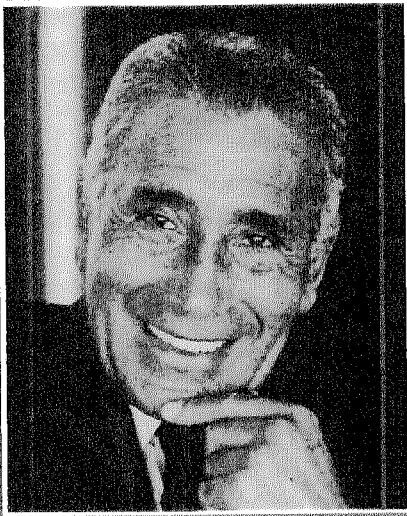
محمد حسنين هيكل

وظلال تتقصد أن تغطى على المستقبل حتى يرتك وتتعثر خطاه ويتملكه شك يغلب اليقين فى عقله وضميرها وبعد ذلك فإن هذا الجواب - أى هذا الكتاب - موجه بالدرجة الأولى إلى أجيال لم تكن هناك تلك اللحظة الفارقة من تاريخ مصر