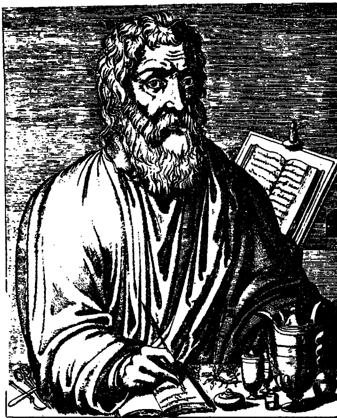
۱ - أبو قراط ، كان يعالج مرضاه بتمرير يديه .