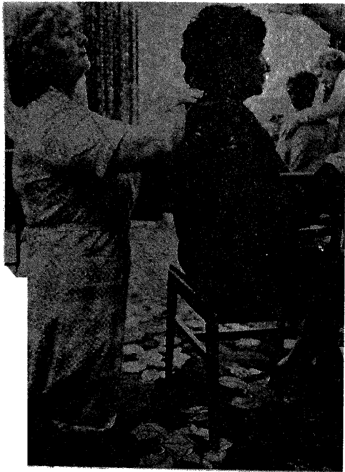
٧ - المعالجة روزداوسون نكتني بوضع يديها على المريض .